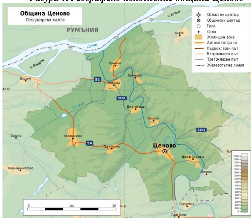
Фигура 1. Географско положение община Ценово